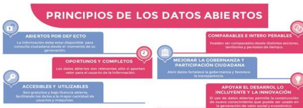
Ilustración 1. Principios de los Datos Abiertos