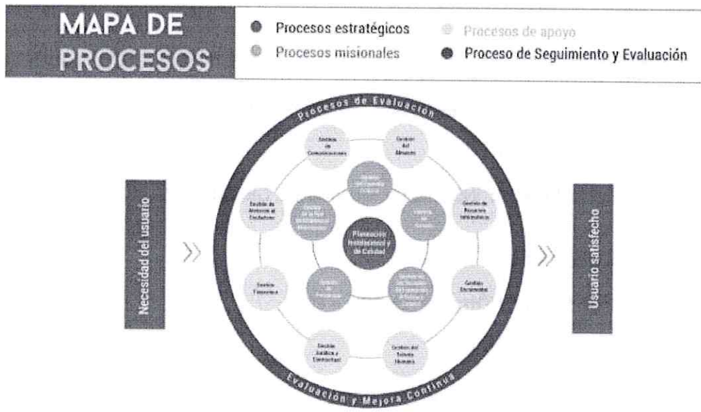
GRÁFICA 1 MAPA DE PROCESOS DEL INSTITUTO MUNICIPAL DE CULTURA Y TURISMO DE CAJICÁ